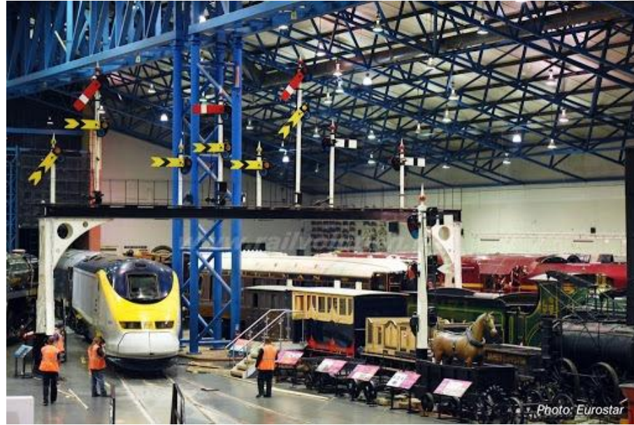
National Railway Museum York