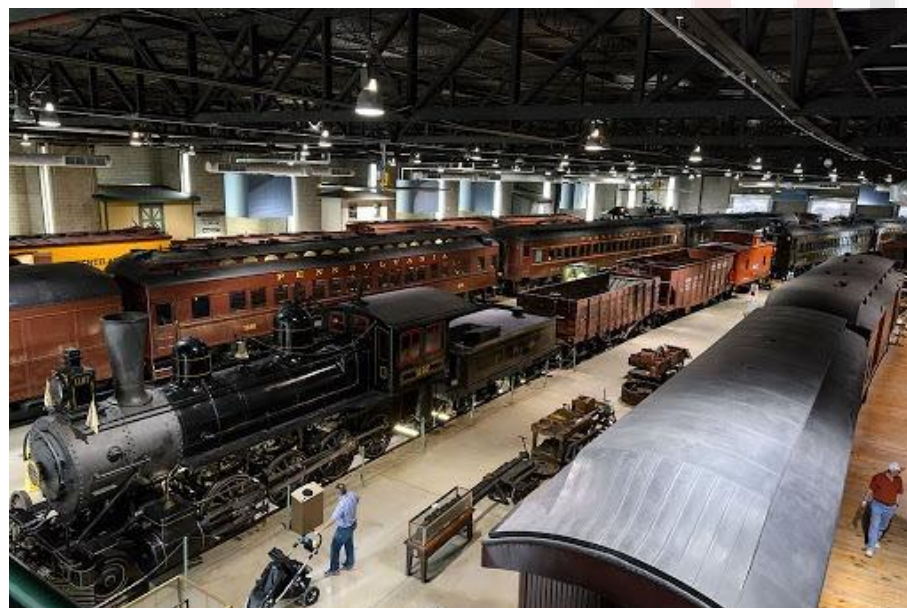
Railroad Museum of Pennsylvania EUA