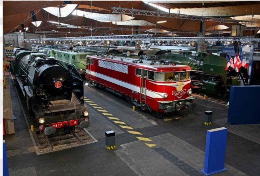
Cité du Train França