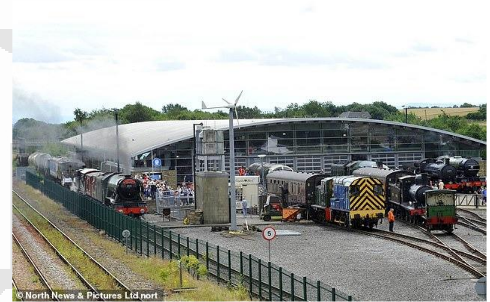
National Railway Museum Shildon