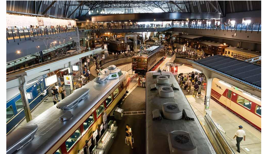
Omiya Railway Museum Japão