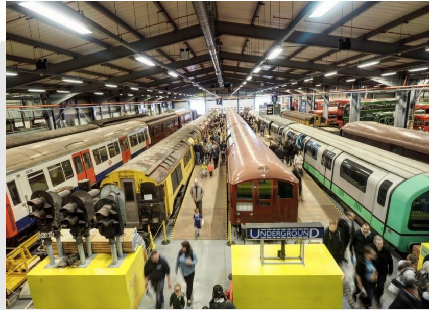
London Transport Museum